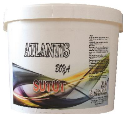
ATLANTIS SUTUT BOJA

DEFINICIJA: Jedno-komponentni hidroizolacioni materijal bele boje (koji se može bojiti), na bazi akrilne kopolimerne smole i na bazi vode, spreman za upotrebu, elastičan, koji se lako može primeniti na sve vrste podova.