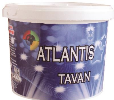
ATLANTIS TAVAN PLASTİK BOYA

DEFINICIJA: Visokokvalitetna, mat, završna boja za PLAFONE, na bazi kopolimera.