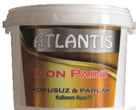
ATLANTIS IRON PAINT AHŞAP VE METAL (SU BAZLI)

Površine koje se nanose moraju biti glatke, čvrste, suve i bez prašine. Prilikom primene na starijim površinama treba obaviti brušenje kako bi se poboljšale performanse boje na prethodnoj površini.