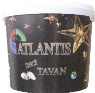
ATLANTIS İNCİ TAVAN BOYA

DEFINICIJA: Visokokvalitetna, mat, završna boja za PLAFONE, na bazi kopolimera.